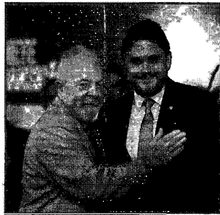
LULA: "ELETEM QUE PROVAR INOCÊNCIA"

"Já pedi para o ministro Rui Costa convocar ele para segunda-feira para gente ter uma conversa porque ele tem