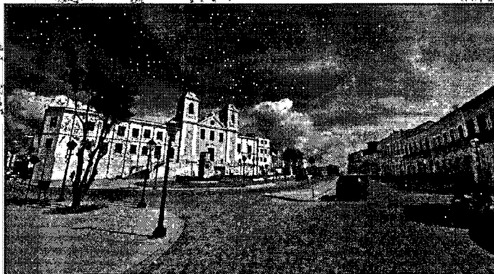
O OBJETIVO É APRESENTAR OS ATRATIVOS TURÍSTICOS DA CAPITAL, ALÉM CONVIDAR OS AGENTES DE VIAGENS E PÚBLICO FINAL A COMERCIALIZAREM E CONHECEREM A CIDADE

O evento é um grande ponto de encontro de profissionais do ramo e reúne empresas nacionais e estrangeiras que buscam promover seus negócios