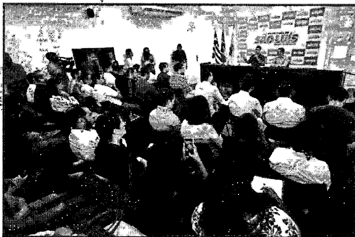
DECLARAÇÃO FOI NESTA QUARTA-FEIRA (2), NO AUDITÓRIO DO PALÁCIO LA RAVARDIÉRE

"Nos últimos dois anos, só na Avenida Litorânea foram gastos mais de R$ 2 milhões com serviços de tapa-buracos, toda vez que fazíamos o serviço, a chuva vinha e precisávamos voltar lá novamente, por isso, decidimos retirar todo o asfalto velho e colocar um asfalto novo, isso nos permitiu