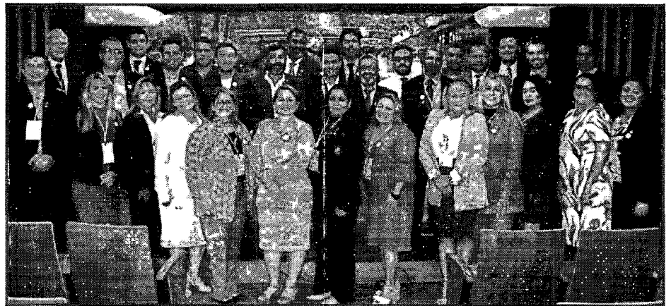
CRTR17 PARTICIPA DA XII CONFERÊNCIA DE EXECUTIVO DO SISTEMA CONTER/CRTRS.